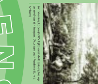
Historische kaart van de regio rond 1672.

Het rampjaar De Republiek van de Verenigde Nederlanden is in oorlog met Engeland en Frankrijk. De Franse koning Lodewijk XIV wil de Republiek van de Verenigde Nederlanden nauwelijks meer bezetting. In 1672 lukt het de Franse koning Lodewijk XIV vanuit Duitland met een leger van 150.000 soldaten de versterkte Rijn over te steken en gebiedend. Het rampjaar 1672 is een feit.