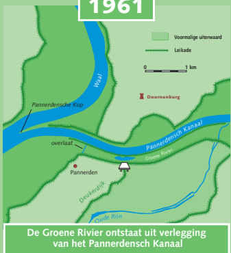
De Groene Rivier ontstaat uit legging van het Pannerdensch Kanaal