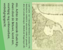
Historische kaart van de militaire verdedigingsgracht.

Ni de twaalfde eeuw van de Franzen, in 1674, overleegen de Nederlanders opvoeren en steden voor het eerst over grote werken in de rivieren. Ze hebben een gezamenlijk besluit de versterkte Rijn bij Lobbië moet weer een militaire barrière worden. Maar verder heerst er roerendheid.