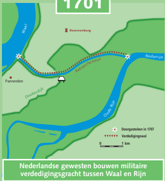
Nederlandse gewesten bouwen militaire verdedigingsgracht tussen Waal en Rijn