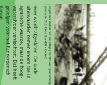
Historische kaart van de economische wederopbouw.

De herenbevelen over het Pannerdensch Kanaal, liden uiteindelijk tot de oprichting van de Natuurnet. Dit was voor de Rijkswaterstaat, in 1798. Ook op andere terreinen wordt Nederland de eenheidsstaat de we nu kennen.