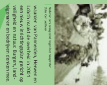
Historische kaart van de veiligheid en natuur werken.

Nederland denkt op wat de rivier, vaker optredende hoogwaters, in 1995 dient zich een bijna-ramp voor. De Rijn de Waal en de IJssel kunnen de water-massa's die dan uit Duitland op ons af komen, nauwelijks verwerken. In alle tijden wordt een kwart miljoen mensen gevaarlijk. De gebouwen velen gesloopt. Het rivierwater moet weer de rivier krijgen, ook in de uiterwaarden. En in de uiterwaarden moet de oorspronkelijke, vrijwel geheel verdwenen natuur terugkomen. Voor de uiterwaarden van Pannerden, Heeren en Lobbië maakt de overheid in 2001 een nieuw inrichtingsplan gericht op veiligheid en natuur. Burgers, land-eigenaren en bodemden denken mee.