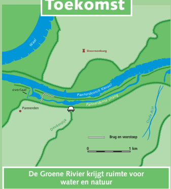
De Groene Rivier krijgt ruimte voor water en natuur